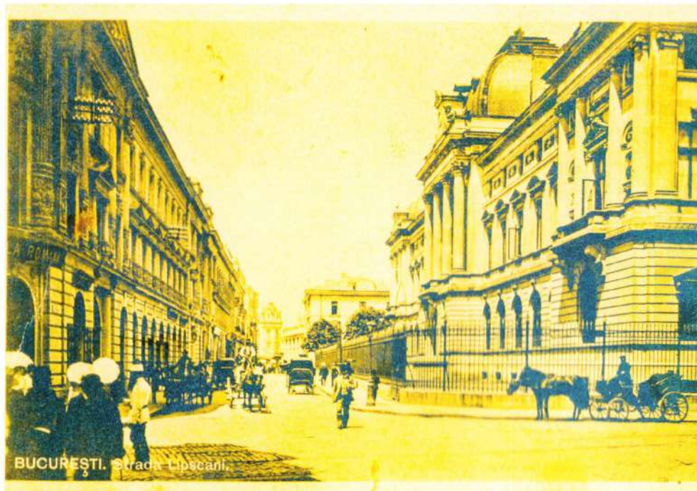
Banca Națională