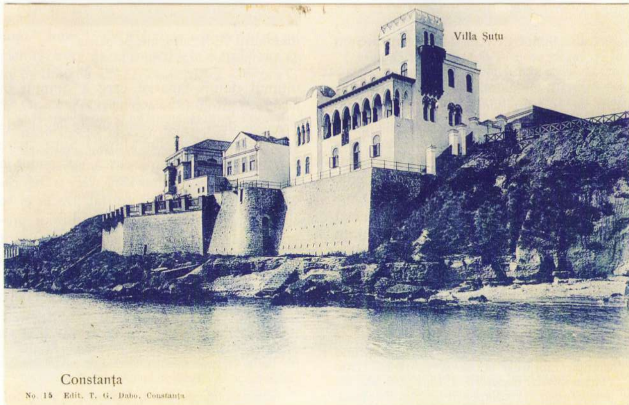
Villa Suțu din Constanța, carte poștală, trimisă de către emitent în data de 28 martie 1909, către Roxane de Grimaldi, Calea Griviței nr. 63, București, Colecțiile speciale ale Bibliotecii Naționale

- cea care ajunge la Mihai I Suțu, domn al Țării Românești în 1783-1786, 1791-1793, 1801-1802 și al Moldovei în 1793-1795, al cărui fiu, Grigore (1761-1836), căsătorit cu Safta Dudescu în anul 1783, a fost