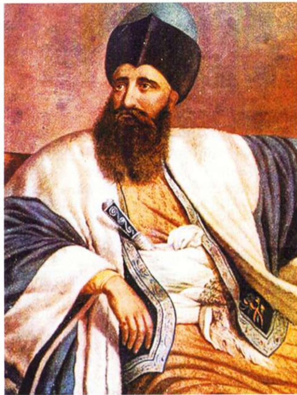
Mihail II Suțu Vv

bolnavi. Aceștia trebuiau să fie, după dorința sa, „puțini, pentru ca ajutorul să poată fi substanțial.”