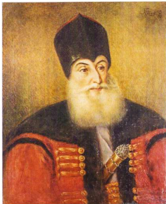
Alexandru Vodă Suțu, ulei pe pânză de Antonie Fotiadis

ultimul domn fanariot care a domnit în Moldova (iunie 1819-martie 1821). 27