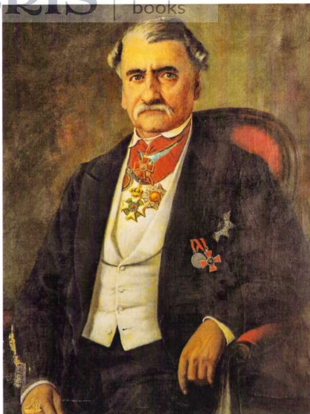
Constantin (Costache) Grigore Suțu, ulei pe pânză, autor necunoscut, colecția Muzeului Național de Istorie din Atena